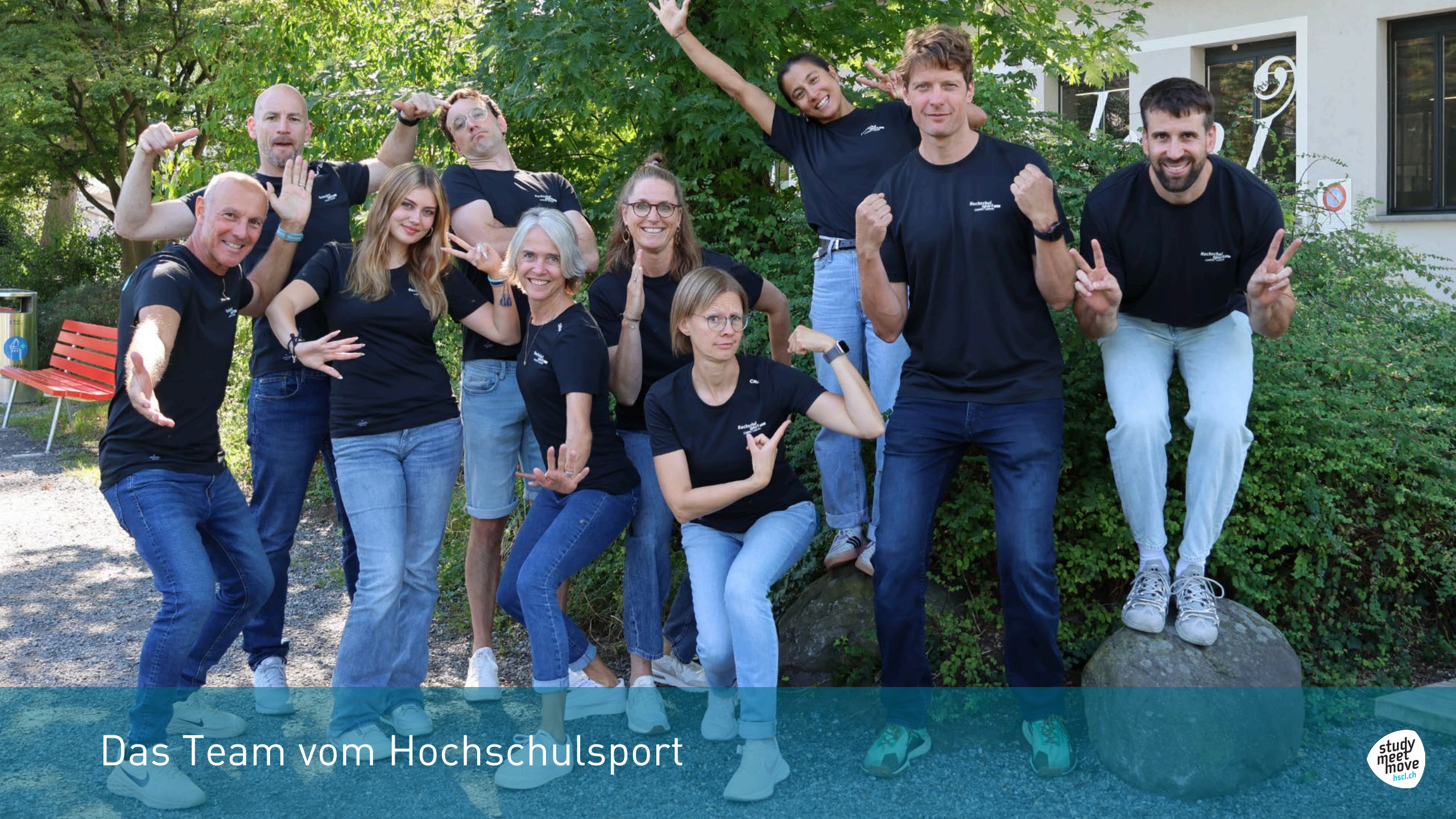
Das Team vom Hochschulsport