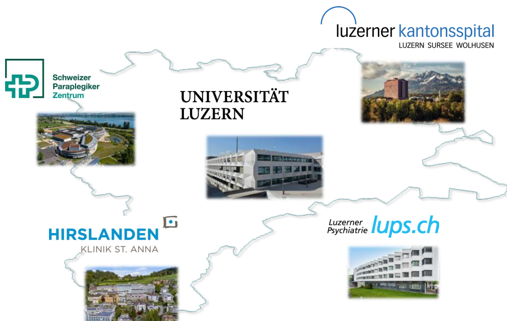
Universität Luzern und Partnerinstitutionen.