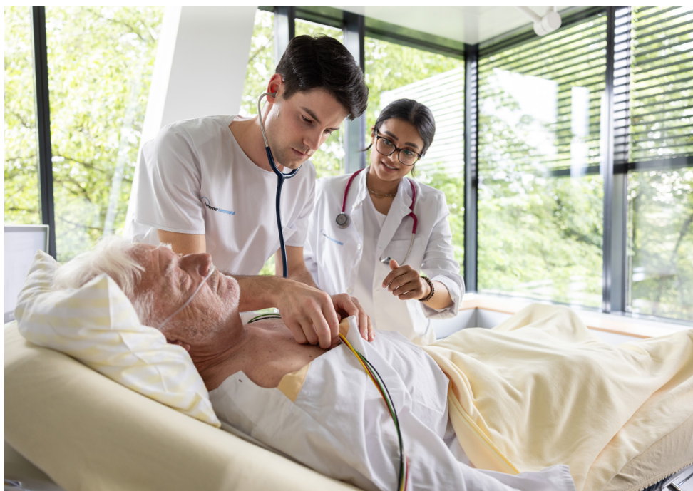
Studierendenunterricht am Patienten.